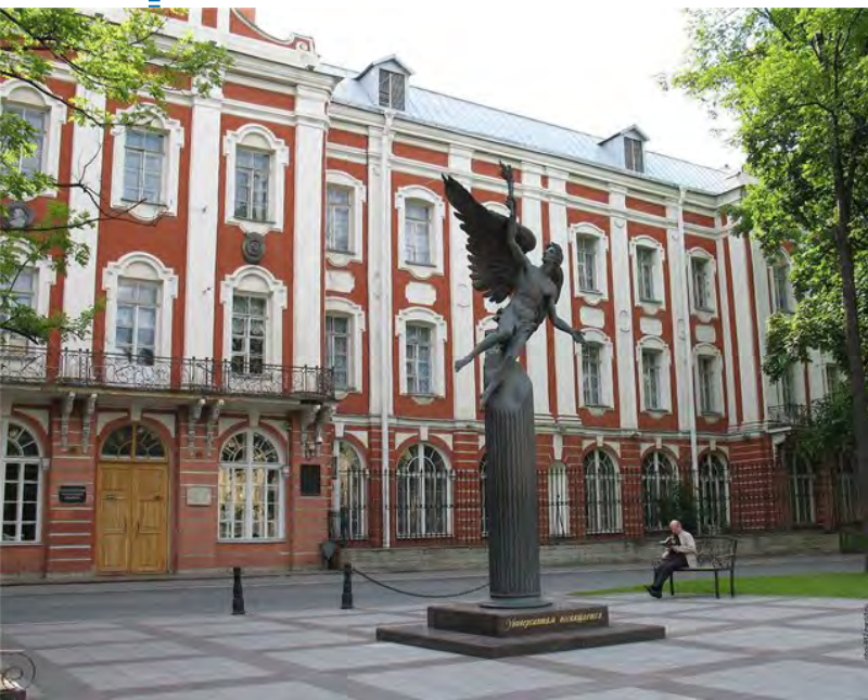
Здание Двенадцати коллегий